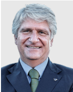
Mohammed Ben Sulayem, Πρόεδρος της FIA

Η μοτοσυκλέτα είναι ένα σημαντικό τμήμα της αυτοκίνησης που έχει ιστορικό και τεχνολογικό ενδιαφέρον τόσο για τους λάτρεις όσο και για τους συλλέκτες. Ο οικονομικός και κοινωνικός αντίκτυπος της κληρονομιάς της αυτοκίνησης είναι ανεκτίμητος και πρέπει να προστατευθεί. Τα κομμάτια της ιστορίας μας πρέπει να διατηρηθούν και να ληφθούν υπόψη στο νομοθετικό πλαίσιο.