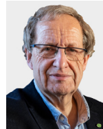
Giuseppe Redaelli, Πρόεδρος της Διεθνούς Ιστορικής Επιτροπής της FIA

Από το 1966 η FIVA έχει ως βασική δέσμευση τη διατήρηση και την τελετουργική παρουσίαση των ιστορικών οχημάτων. «Τα οχήματα του χτες στους δρόμους του αύριο» παραμένει η αποστολή μας. Παίρνοντας δύναμη από το πάθος εκατομμυρίων ανθρώπων, θα διασφαλίσουμε ότι οι επόμενες γενιές θα μπορούν να απολαμβάνουν τα ιστορικά αυτοκίνητα και τις μοτοσυκλέτες όπως και εμείς τώρα