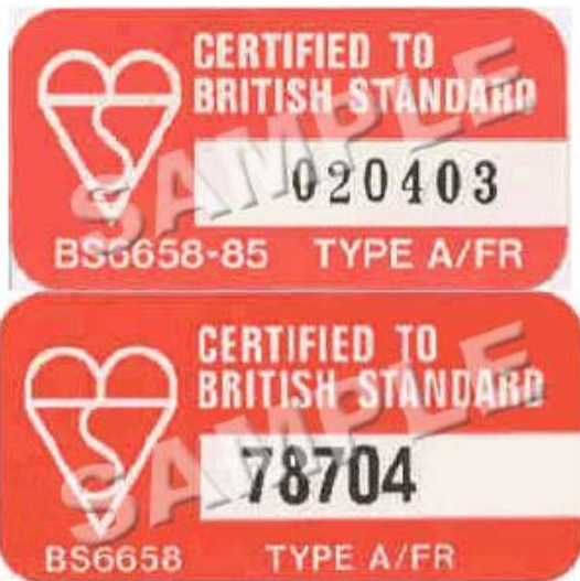
BSI 6658-85 type A/FR

Τα επιτρεπτά κράνη είναι τα ακόλουθα (φαίνονται και δείγματα των αντίστοιχων ετικετών):