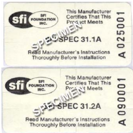
SFI 31.1 ή 31.1A ή 31.2A

(Δεν ισχύει μετά την 31/12/2013 για διεθνείς αγώνες ή μετά την 31/12/2015 για εθνικούς αγώνες)